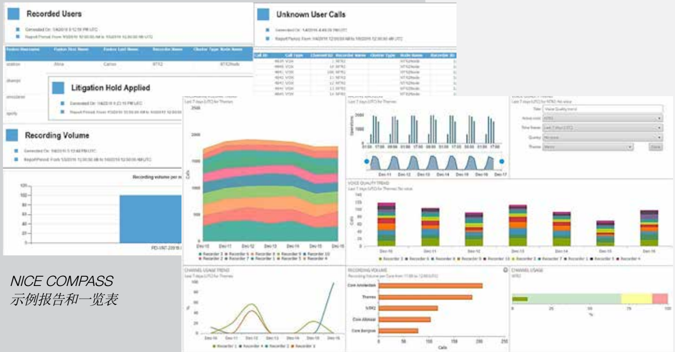
NICE COMPASS 示例报告和一览表